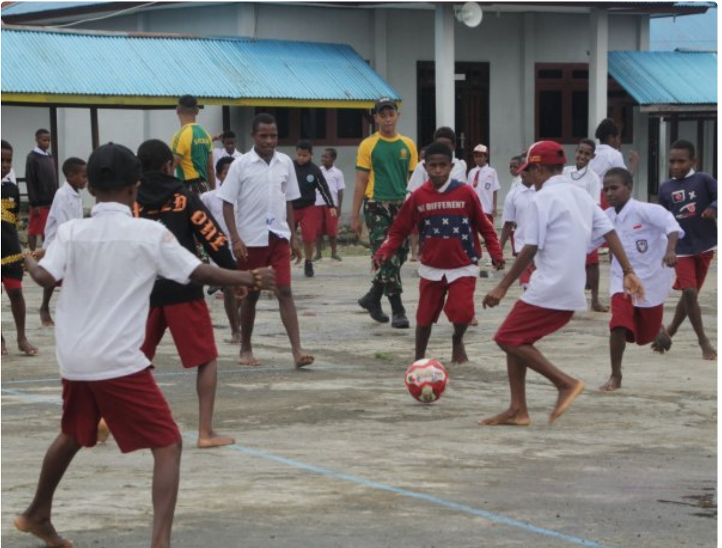
Foto: Saat Satgas Pamtas Mobile RI-PNG Yonif 503/Mayangkara mengajak main sepak bola siswa SD Inpres Kenyam, Distrik Kenyam, Kabupaten Nduga, Papua, Kamis 6 Februari 2025.