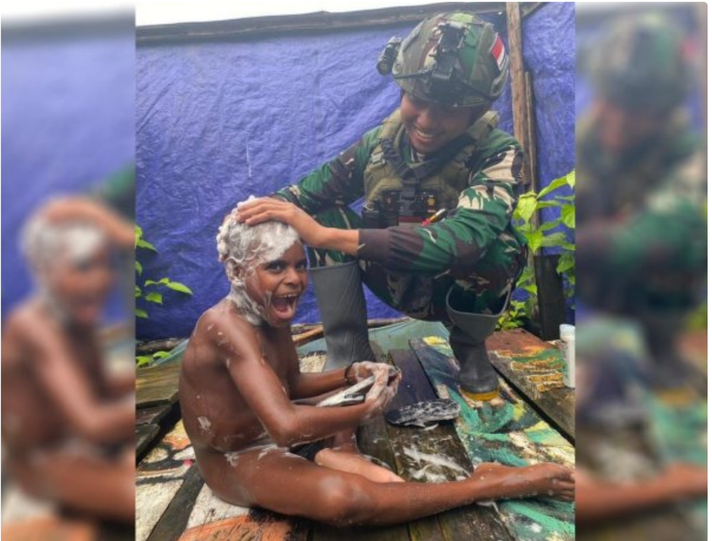
Foto: Saat Satgas Pamtas Mobile RI-PNG Yonif 503/Mayangkara Koops Habema Mengajarkan Anak-anak Menjaga Kebersihan Dengan Mandi Air Bersih di Pos Batas Batu, Kecamatan Batas Batu, Kabupaten Nduga, Papua Pegunungan, Kamis (04/07/2024).

NDUGA- Satgas Pamtas Mobile RI-PNG Yonif 503/Mayangkara Koops Habema