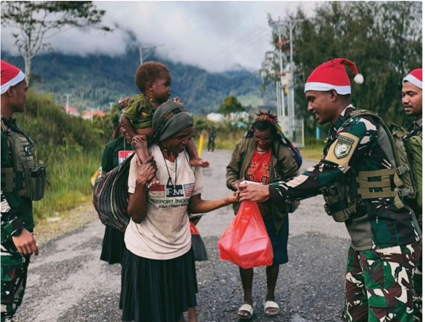
Foto: Satgas Yonif 509 Kostrad memberikan makna baru pada patroli keamanan dengan berbagi kebahagiaan bersama masyarakat di Intan Jaya, Papua.